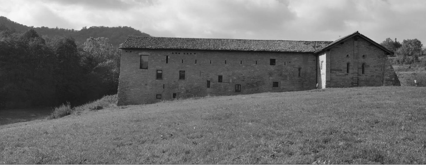
arch. F. Thomasset, arch. R. Gambino, NQA-Nuova Qualità Ambientale, dott. S. Assone, dott. F. Valfé di Bonzo

A-INTERPRETAZIONE STRUTTURALE ANALISI PAESISTICHE maggio 2018 1:15.000